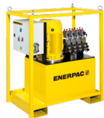
Pompes à débits séparés de la série SFP