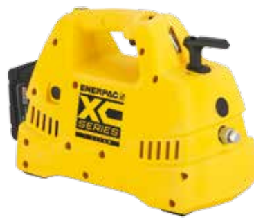
Pompes sans fil de la série XC