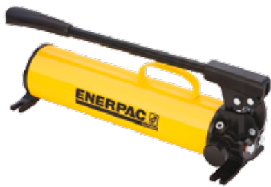
Pompes à main de la série P

Avec des modèles manuels, à batterie, électriques, pneumatiques et à essence, Enerpac propose la gamme de pompes la plus complète sur le marché.