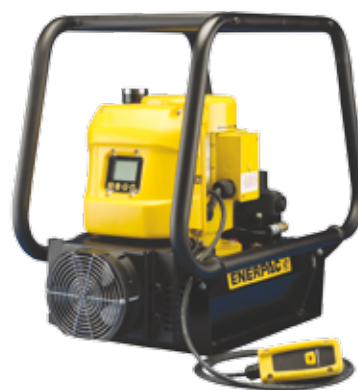
Pompes électriques de la série ZE