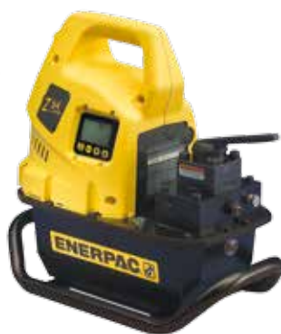
Pompes électriques portatives de la série ZU4