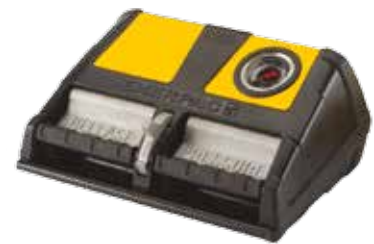
Pompes pneumatiques de la série XA