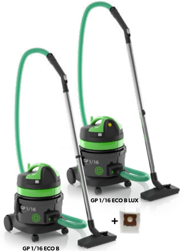
GP 1/16 ECO B